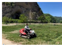
芝生広場・ヘリポート周辺 福祉施設