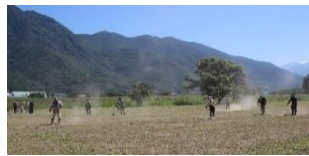
多目的グラウンド シニアソフトリーグ