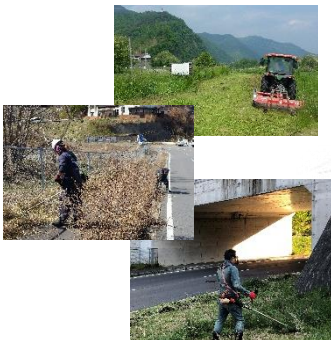
千曲公園の魅力アップ