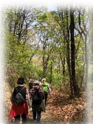
千曲公園ウォーキング